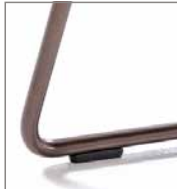
Drahtrohrgestell verschiedene Metallfarben F M5