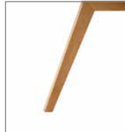
Holzfuß Eiche geölt P58 ohne Mehrpreis F M8