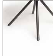
Stativgestell schwarz F 8A